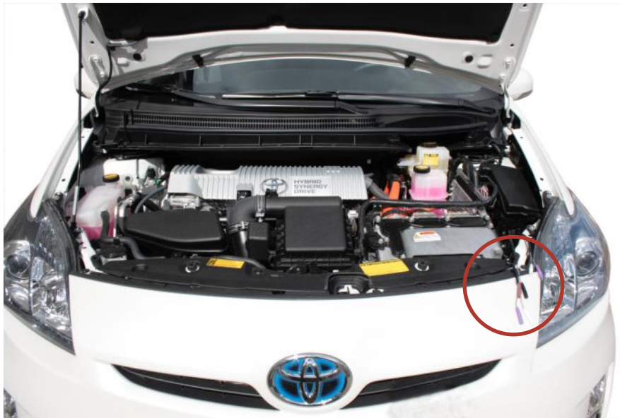
Abbildung zeigt das Schulungsfahrzeug Toyota Prius III mit herausgeführten Messbuchsen (roter Kreis) zum Messen ohne Abziehen der Bauteilestecker