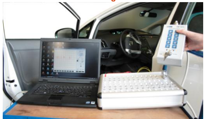
Abbildung zeigt das direkte Messen des CAN-BUS Signals über das PC-Speicher-Oszilloskop und die Möglichkeit der Fehlerschaltung